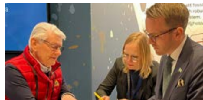
39 Statsbidraget till enskild väghållning ses över