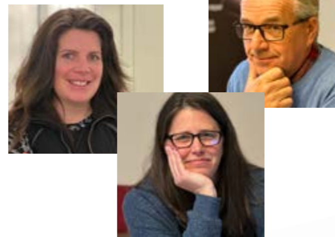
24 I huvudet på våra rådgivare