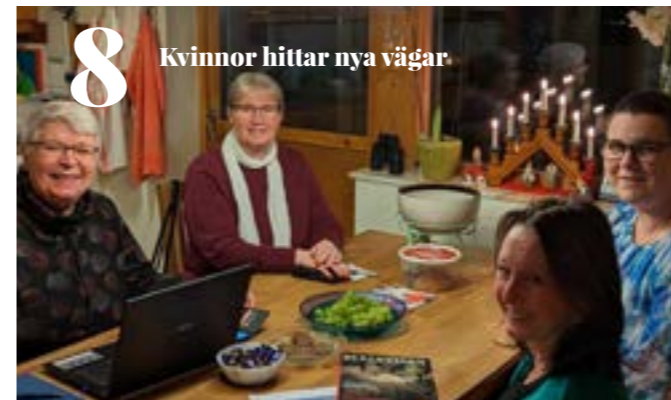
8 Kvinnor hittar nya vägar