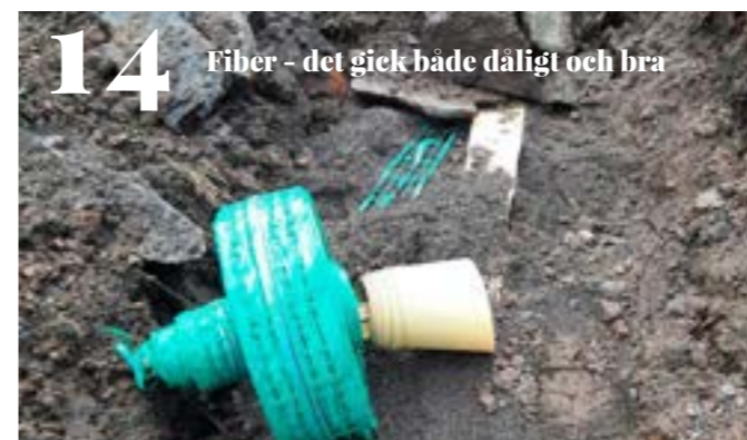
14 Fiber - det gick både dåligt och bra