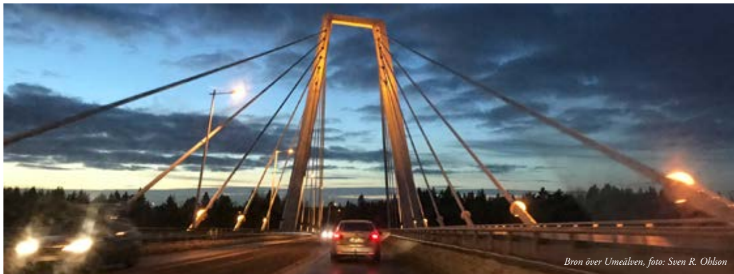
Bron över Umeälven

*Umeå tingsrätt, mark- och miljödomstolen 2025-06-30 mål nr F 2789-21