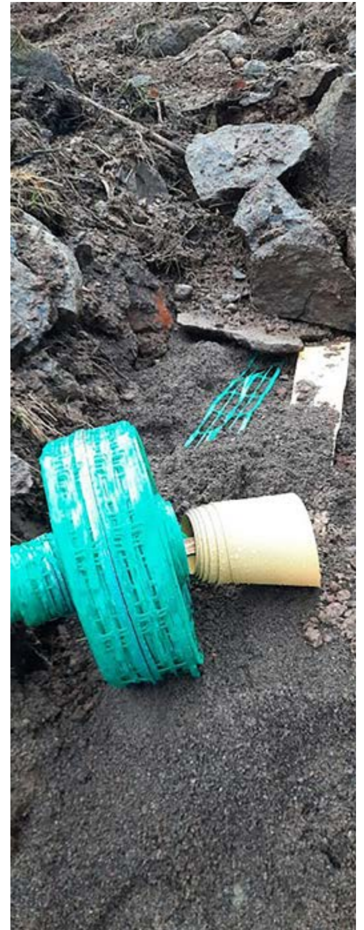
Alldeles för grovt material användes direkt över ledningarna.

Detta för att inte riskera att ord står mot ord när det gäller dom detaljerna.